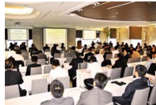
総会には57社70名の会員をはじめ7社の報道関係者が参加