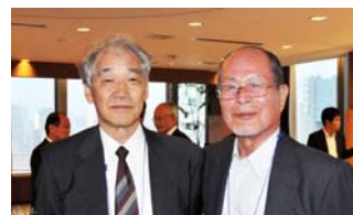
振井新会長(左)と 高瀬前会長(右)