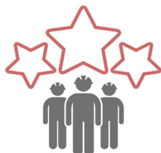
見える化評価制度 ロゴマーク