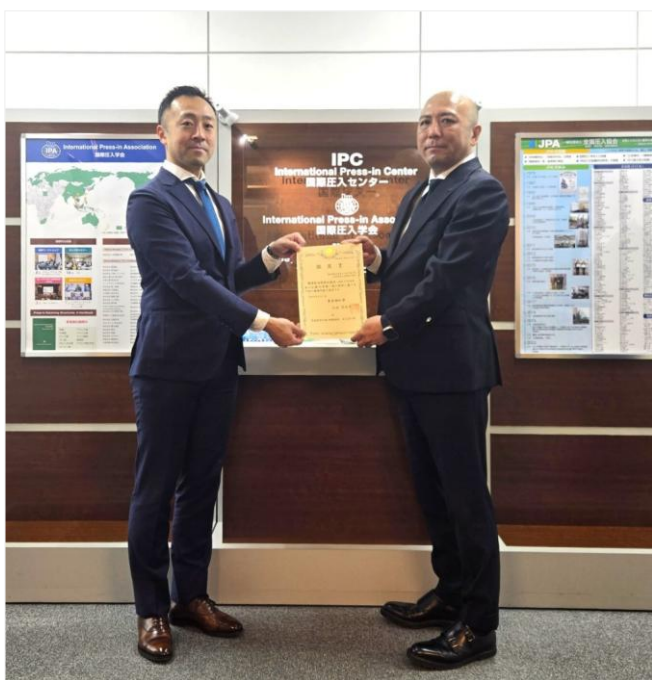
【認定書授与の様子】

近年、建設業界においては、熟練技能者の高齢化や担い手不足が進行しており、確かな技能と高い安全意識を備えた人材の育成が、これまで以上に重要となっています。当協会では、本認定訓練を通じて、圧入施工技能のさらなる向上と工事の安全確保に一層取り組んでまいります。