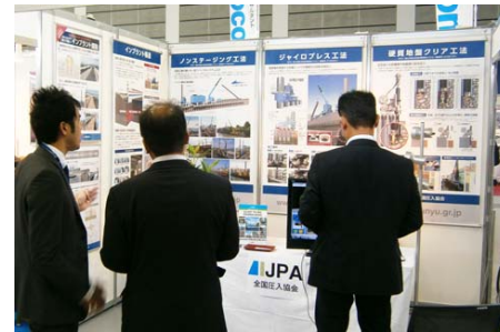
EE東北'12 出展状況 (10月24-25日開催、約9,800名来場)