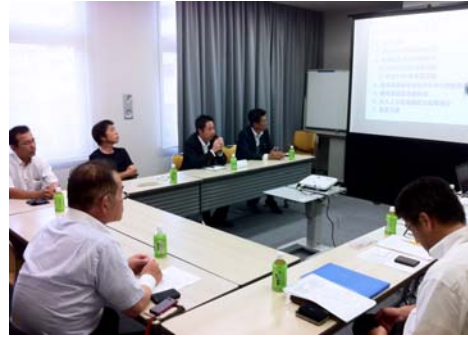
中国地区の会議風景