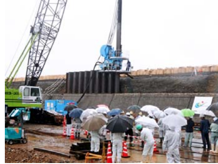
見学会(第1工区)の様子

10月10日に開催した現場見学会には、官公庁、コンサル、ゼネコン、報道関係者など93名が参加。既設堤防に硬質地盤クリア工法で鋼矢板を打設する様子が紹介されました。開催状況は地元のNHKニュースや新聞紙、建設専門紙でも報道され、インプラント構造による防災・減災対策への関心の高さが示された見学会となりました。