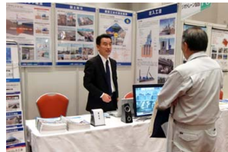
九州建設技術フォーラム2012 出展状況 (10月31日開催、約1,700名来場)

国土交通省東北地方整備局主催の技術展「EE東北」と、九州建設技術フォーラム実行委員会主催の「九州建設技術フォーラム」に、ブースを出展しました。地盤や施工環境を選ばず急速・省スペースに杭施工を行える圧入技術に、参加者から感嘆の声が寄せられました。