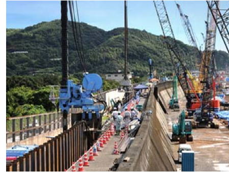
全7工区で7台の同時圧入施工を実施